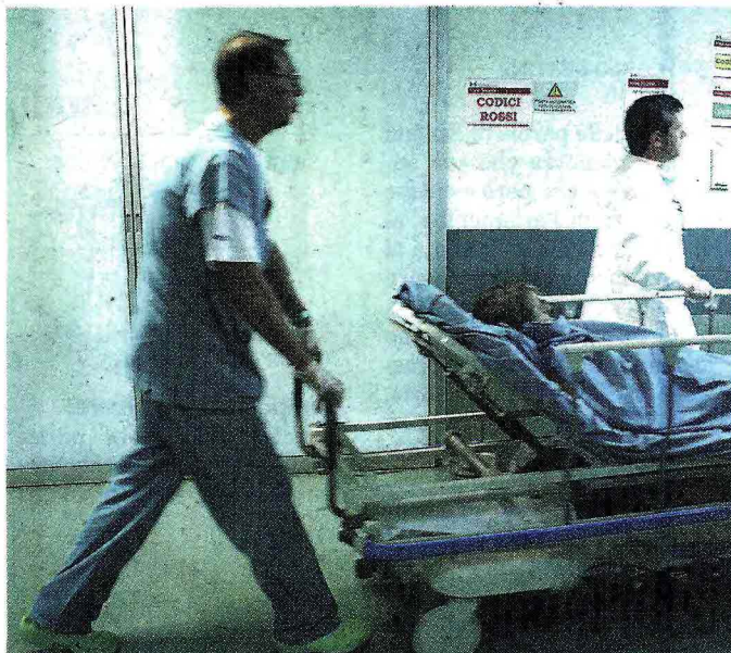
Evitati i tagli in manovra, ma le Regioni dovranno risparmiare

Applicando lo standard di 3,7 posti letto ogni mille abitanti i posti letto da chiudere sarebbero 14mila ma con forti variazioni da una regione all'altra. Se in Piemonte mancherebbero addirittura 450 letti in Emilia ce ne sarebbero duemila di troppo. Ma niente tagli a casaccio. Il piano farebbe infatti passare sotto la mannaia quelli poco utilizzati o dove i pazienti sono costretti a degenze più lunghe di una settimana. Il Piano esiti ospedalieri del Ministero, mostra