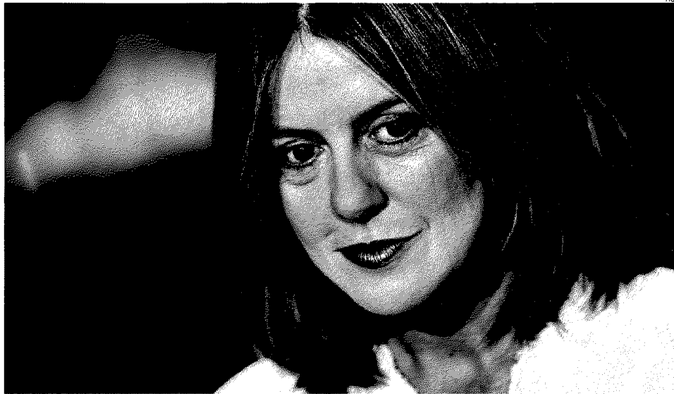
Ministro della Salute. Beatrice Lorenzin