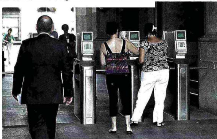
Dipendenti statali all'ingresso di un ministero

Ritaglio stampa ad uso esclusivo del destinatario, non riproducibile.