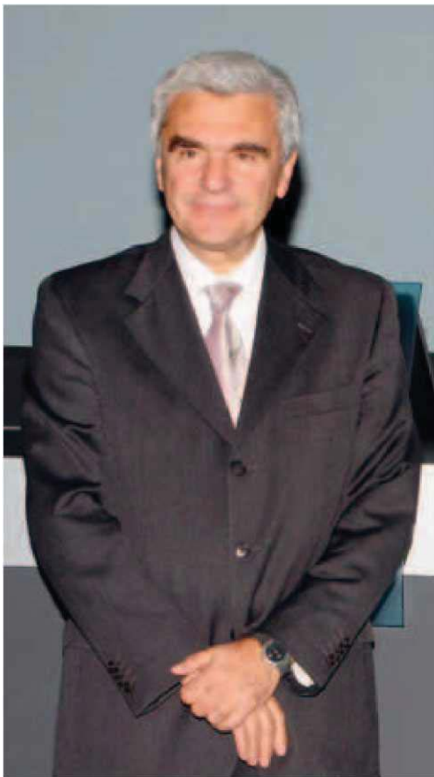
Renato Balduzzi è da mercoledì ministro della Salute