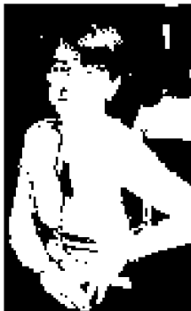
Il sottosegretario Eugenia Roccella

«ABBIAMO dato alle Regioni una griglia precisa a cui fare riferimento. Quando tireremo le somme sul primo anno di Ru486 vedremo chi l’ha rispettata. Mi sembra normale che prevalga sulle loro decisioni». La sottosegretaria Roccella è stupita della decisione dei tecnici toscani. «La somministrazione in regime di ricovero ordinario è stata prima di tutto prevista dall’allora ministro alla salute Sacconi, nel parere legislativo mandato alla Commissione europea dopo che il farmaco, in base al mutuo riconoscimento, è stato approvato in Italia. Inoltre abbiamo il parere della commissione parlamentare che si è occupata della pillola e infine ben 3 pronunciamenti del Consiglio superiore di sanità. Faccio notare che i membri nelle tre occasioni erano diversi, e a nominarli sono stati tre ministri diversi, di governi di centrodestra e di centrosinistra. Ecco, perché un Comitato locale dovrebbe avere più