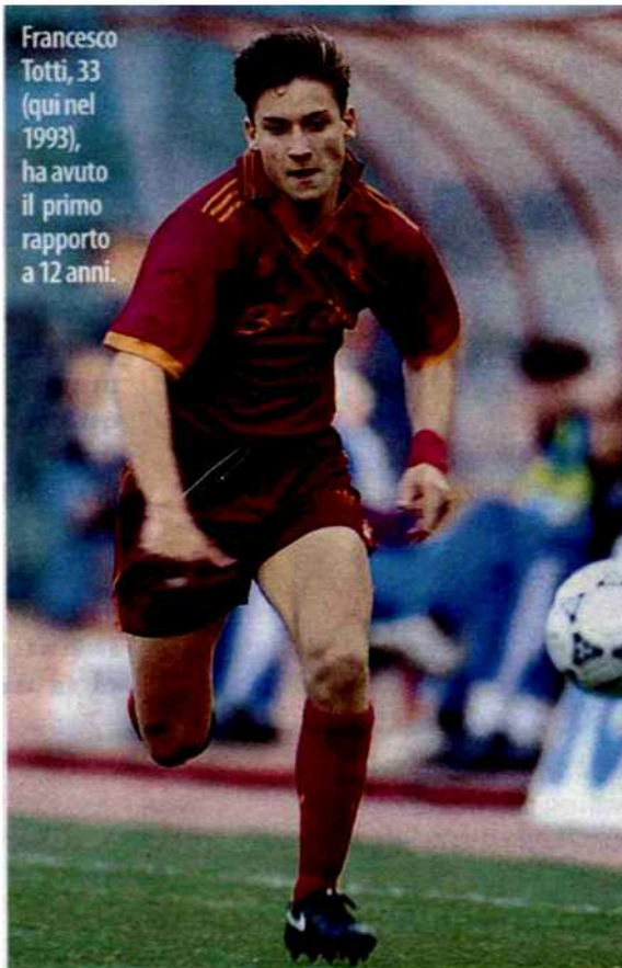
Francesco Totti, 33 (qui nel 1993), ha avuto il primo rapporto a 12 anni.

aspettative. E invece per inesperienza, mancanza di innamoramento, assenza di conoscenza affettiva e fisica, non riescono a valorizzare gli aspetti costruttivi dell'esperienza sessuale e si ritrovano in larga parte delusi. Il problema è che in televisione o al cinema, si rappresentano passioni ed emozioni tralasciando ogni accenno sulla contraccezione e la prevenzione di malattie. E così, chi procede per imitazione, oltre alla delusione finisce per essere più esposto a gravidanze indesiderate o al rischio malattie.