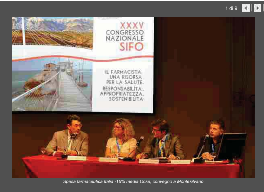
Spesa farmaceutica Italia -16% media Ocse, convegno a Montesilvano

Indietro Stampa Invia Scrivi alla redazione Suggestisci ()