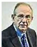
Il ministro dell'Economia Pier Carlo Padoan