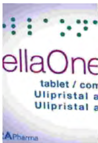
La pillola contraccettiva ellaOne

Aiuto ha anche puntualizzato: «Come Direttore Generale di una società impegnata nell'innovazione nella Health Care per le donne sottolineo l'importanza di un momento come questo per l'Italia. Siamo dunque lieti di vedere che anche nel nostro Paese per le donne adulte si sia facilitato l'accesso a questa metodica contraccettiva», ha concluso. ●