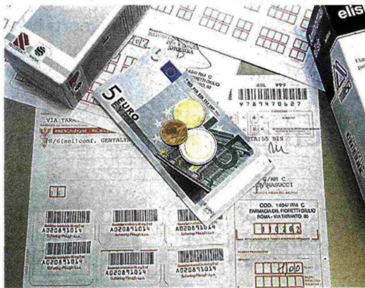
Cresce l'esborso dei cittadini per i ticket

IN TRE ANNI ESBORSO CRESCIUTO DEL 25 PER CENTO AI PRIMI POSTI LOMBARDIA, VENETO E LAZIO