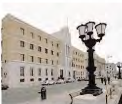
La sede della Regione

«Questo vaccino, terapeutico e non di prevenzione — ha spiegato — va a riconoscere gli