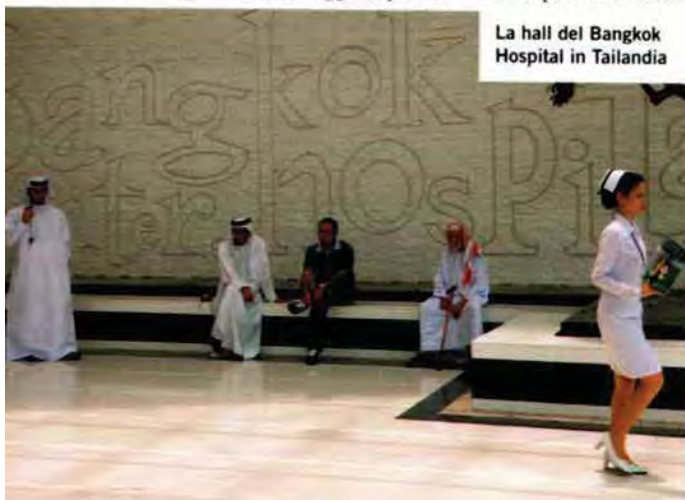
La hall del Bangkok Hospital in Thailandia

Ma il Sud America è dannatamente lontano e, anche se gli interventi sono più economici che non in Italia, il viaggio in sé non è per tutte le tasche. Diverso, invece, è il caso della vicina Tunisia che sta riscuotendo un grande successo tra gli italiani: «Nel 2009 abbiamo effettuato oltre 1.500 interventi di turismo medico, e per il 2010 siamo a una media di 138 al mese», fanno sapere i responsabili dell'agenzia Chirurgia&Vacanze. La Tunisia si avvia a essere il principale competitor dei paesi dell'Europa orientale che ancora sono meta privilegiata nel settore delle "dental holiday": i cittadini dell'Unione con il mal di denti si muovono verso Est. La meta prediletta, però, non sono più Croazia e Slovenia, per via dei prezzi troppo alti rispetto alla nuova concorrenza di Ungheria e Polonia soprattutto. ■