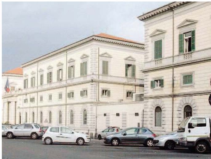
Il policlinico militare del Celio

risarcire la paziente per danno biologico e morale. Ma ora, come deciso dai magistrati della Corte dei conti, a pagare sarà il medico che ha effettuato materialmente la prestazione e che,