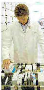
MEDICINE Un farmacista al lavoro

Sui tempi del rinnovo della convenzione, però, nessuno si sbilancia. «Va elaborata a livello nazionale e poi recepita dalle Regioni, ma se quella nazionale verrà fatta con determinati criteri il recepimento sarà automatico ed equanime», spiega Luca Coletto, coordinatore degli assessori della Sanità. «Magari - prosegue - in un anno non ce la facciamo, ma chissà magari ci riusciamo entro nove mesi. C'è tanta carne al fuoco stiamo facendo una revisione globale del nostro sistema sanitario».