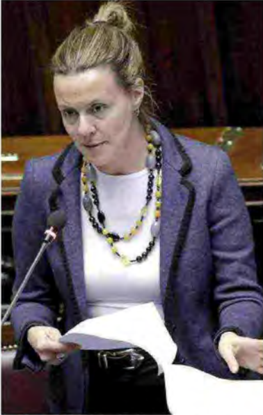
MINISTRO Beatrice Lorenzin