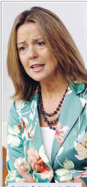
Il ministro Beatrice Lorenzin [Ftg]

Il ministro ha poi riconosciuto che la carenza di personale è un problema del Ssn, «che sarà affrontato nel Patto per la salute». In questo senso sono Lazio, Campagna e Calabria, le regioni maggiormente colpite, perché investite da Piano di rientro. «Dovremo programmare nei prossimi anni il fabbisogno di medici accanto a una valutazione in relazione ai corsi universitari e di specializzazione», ha concluso.