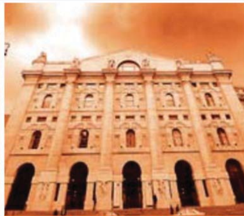
17.7.2011 Rimodulata l'imposta di bollo sul dossier titoli, da 34 a 680 euro