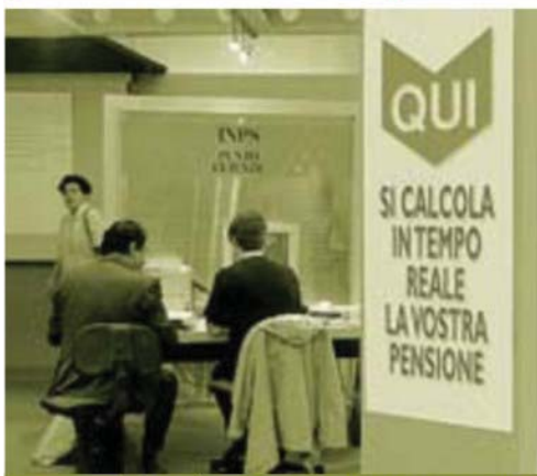
1.1.2013 Ci vorranno tre mesi in più per ottenere la pensione di vecchiaia