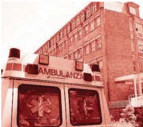
17.7.2011 Scatta il superticket sanitario da 10 euro sulle visite specialistiche