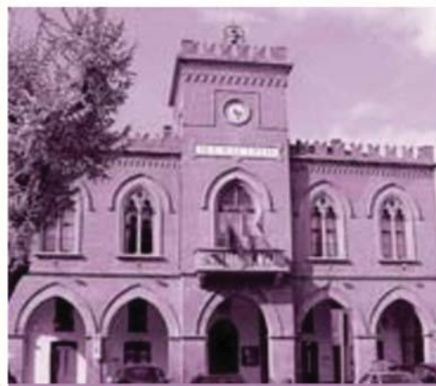
1.1.2013 Tagli agli enti locali per 6,4 miliardi di euro nel biennio 2013-2014