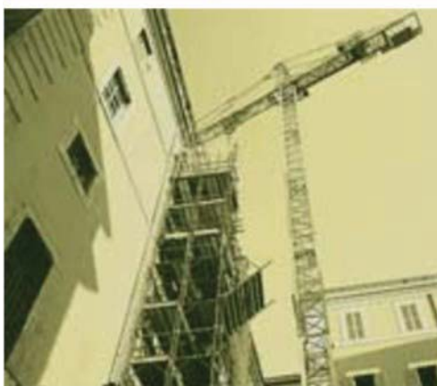
1.10.2013 Riduzione delle agevolazioni fiscali, anche per le ristrutturazioni edilizie