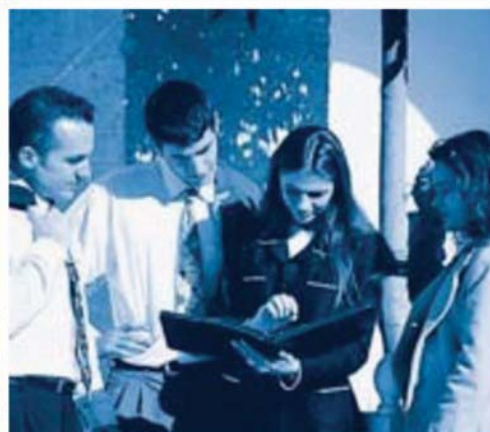
1.1.2012 Forfettone al 5% per chi apre un'impresa e ha meno di 35 anni