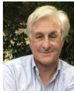
Roberto Canessa Prof. Pediatrics/Cardiology Montevideo, Uruguay